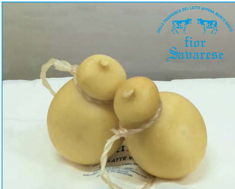
Caciocavallo fresco affumicato