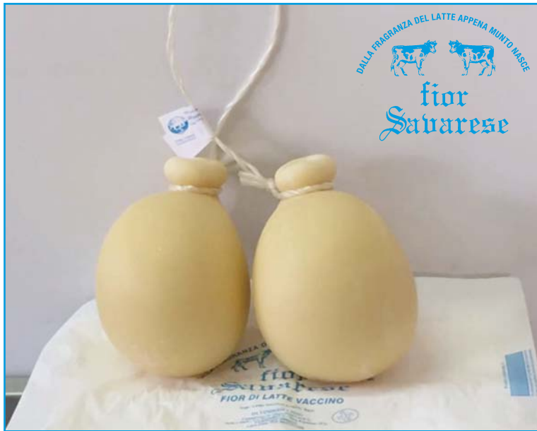
Caciocavallo Podolico stagionato