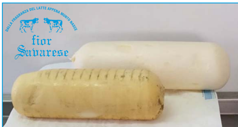
Silano bianco o affumicato a taglio