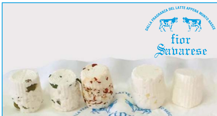
Caciottine fresche miste (bianche, rucola, peperoncino, olive, funghi, limone)