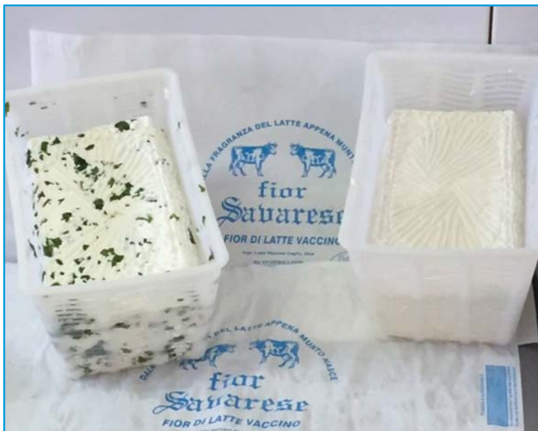
Primo sale assortito (bianco, rucola, peperoncino, olive, funghi, limone)