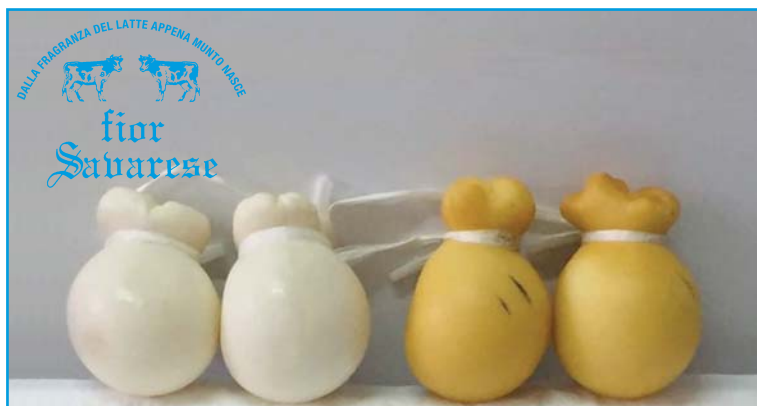
Scamorzina bianca o affumicata da gr. 300