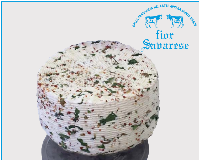
Caciotta fresca a taglio con rucola, peperoncino, olive e funghi