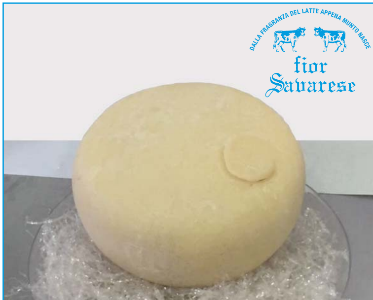
Catamatta: Formaggio morbido stagionato con aggiunta di latte di pecora