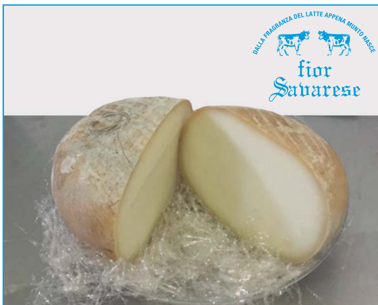
Catamatta affumicata: Formaggio morbido stagionato con aggiunta di latte di pecora