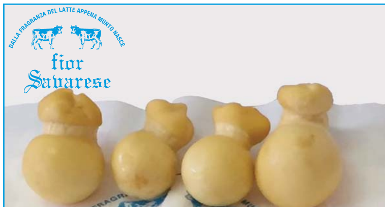
Diavoletti farciti con olive e peperoncino per la piastra