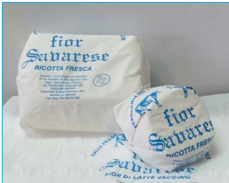
Ricotta tipo Roma con aggiunta di panna e latte vaccino a taglio o porzionata