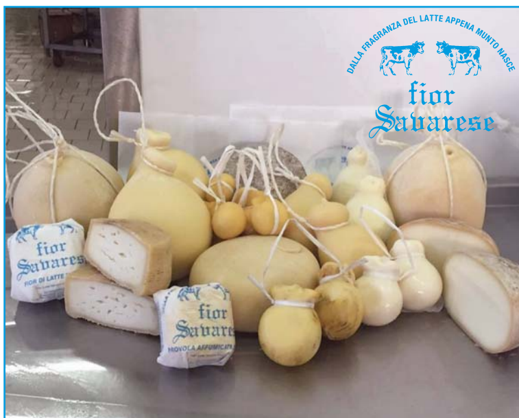
Gamma completa di tutti i prodotti di nostra produzione