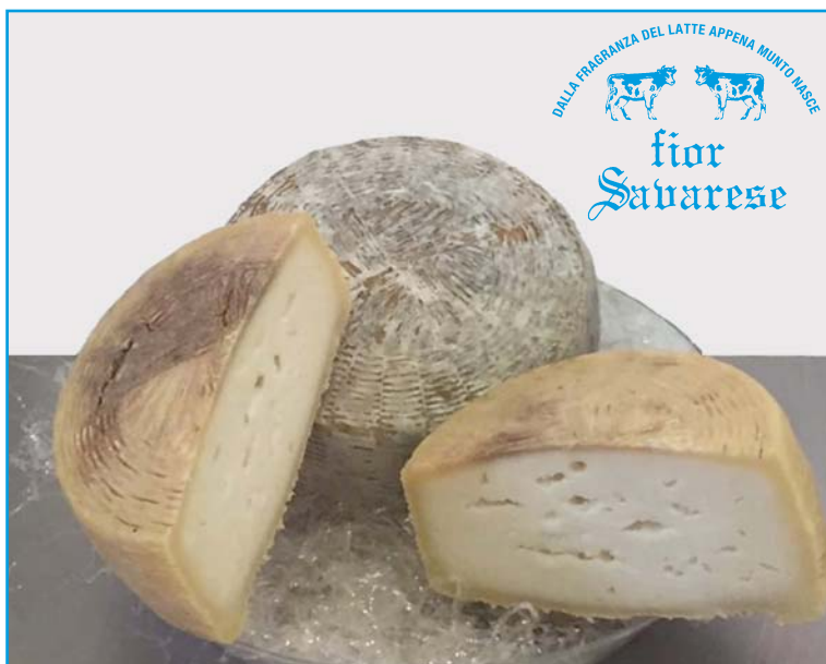
Caciotte stagionale con assoluto latte di pecora