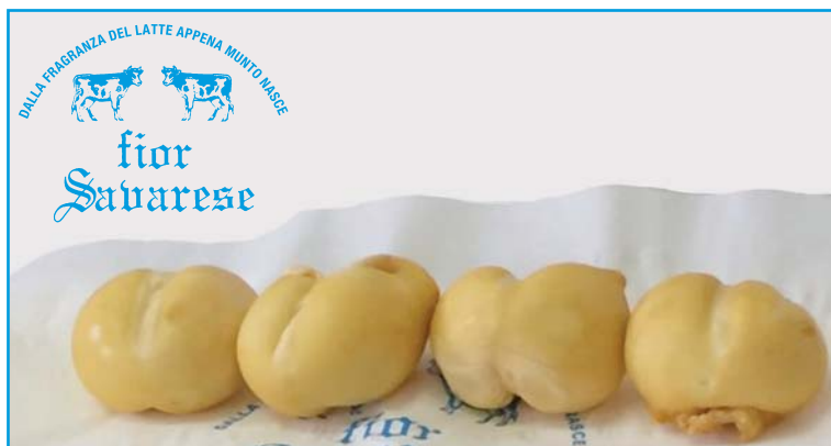
Cacetti farciti con prosciutto e olive o prosciutto e funghi