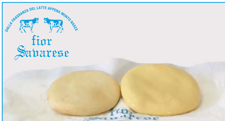
Piadine affumicate per la piastra