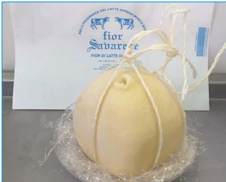
Provolone del Monaco tipico locale stagionato