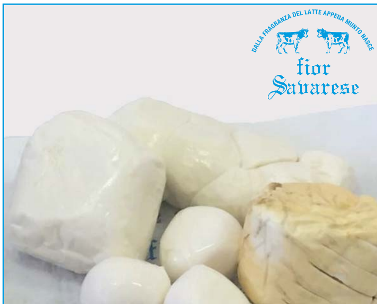
Latticini freschi: provola affumicata, fior di latte, bocconcini, trece